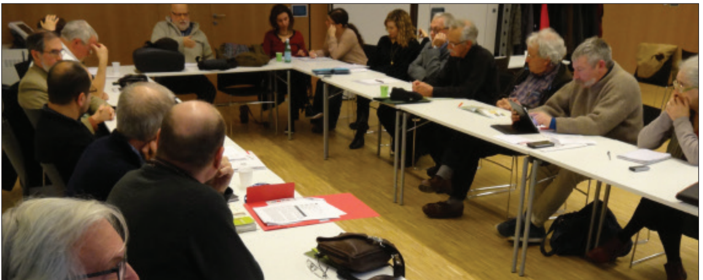
TABLE-RONDE 1 : LA PLACE DE LA LANGUE OCCITANE DANS LES PARCS NATURELS RÉGIONAUX

22 participants se sont réunis autour de cette question :